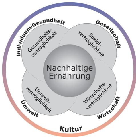
Fünf Dimensionen einer Nachhaltigen Ernährung

Im Online-Video-Kurs „Nachhaltigkeit in der Ernährung“ werden die Auswirkungen des Ernährungsverhaltens sowie der Ernährungssysteme auf die fünf Dimensionen Umwelt, Wirtschaft, Gesellschaft, Gesundheit und Kultur aufgezeigt: auf regionaler, nationaler und weltweiter Ebene. Ausgangspunkt sind globale Herausforderungen wie Klimawandel, Armut/Welthunger, Wassermangel, Existenzsicherung kleiner und mittlerer Betriebe sowie ernährungsmitbedingte Krankheiten. Zentral ist die Vermittlung von praktischen Lösungsmöglichkeiten anhand von sieben „ Grundsätzen für eine Nachhaltige Ernährung “.